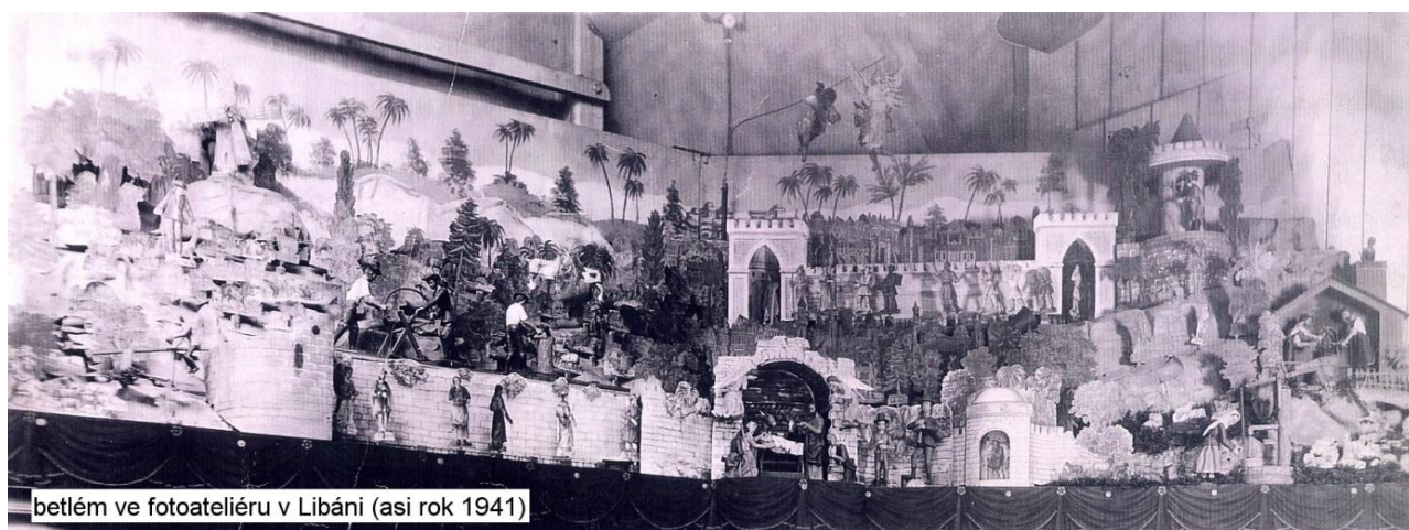
betlém ve fotoateliéru v Libáni (asi rok 1941)