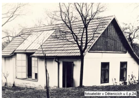
fotoateliér v Dětenicích u č.p.24

Ke každé poctivé fotografické živnosti patří fotoateliér. Ten první vzniká roku 1901 na pozemku u č.p.24 v Dětenicích. Je napřed dřevěný, ale poté přebudovaný jako zděná stavba (budova doposud stojí a je v ní umístěna drobná truhlářská dílna). Druhý ateliér otevřel roku 1911 v nedalekém městě Libáni. Jednalo se o stavbu dřevěnou (dřevěná stavba se nedochovala, ale byla umístěna v prostoru mezi současnou hospodou U Koruny a restaurací Radnice).